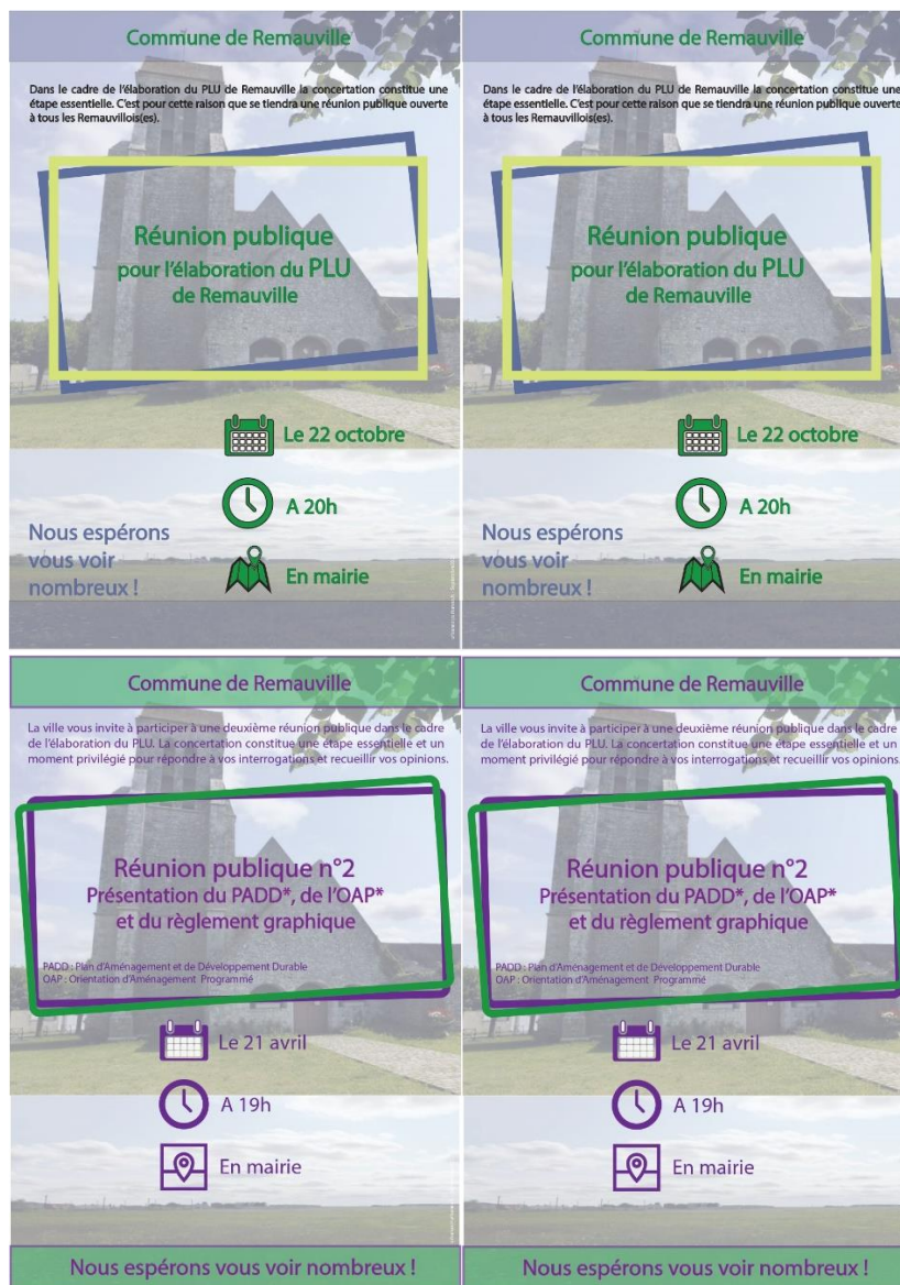
Figure 1 : Les flyers distribués aux habitants

Avec comme élément de départ les couleurs de Remauville, une identité visuelle a été construite pour les différents documents composant le nouveau PLU. À chaque temps de la concertation et pour annoncer les réunions publiques la distribution d'une feuille d'information municipale dans les boîtes aux lettres des habitants de la commune, sous forme de 'flyer' au format A5 a été réalisée. En complément une affiche était également exposée à l'entrée de la mairie pour communiquer les dates et le sujet des différentes réunions.