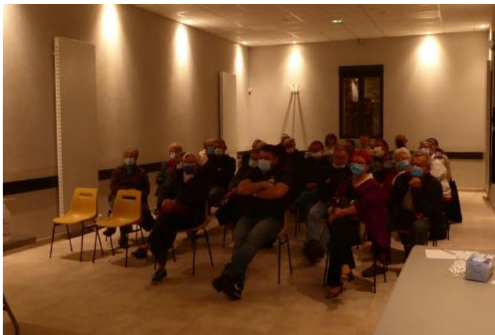
1e réunion publique 22 octobre 2021